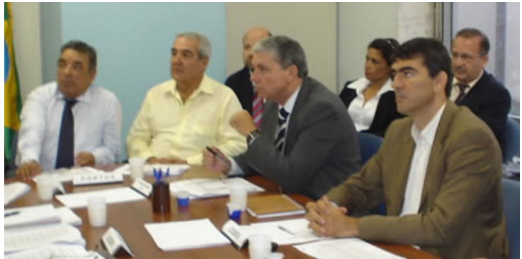
Reunião na sede do Portus, no Rio de Janeiro