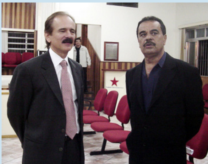
O ministro Pedro Brito ouviu as reivindicações do SINDAPORT e prometeu atendê-las

Em reunião realizada em Brasília a pedido do SINDAPORT, por meio da Federação Nacional dos Portuários, o ministro da Secretaria Especial de Portos, Pedro Brito, reconheceu o pleito do nosso SINDICATO que sugeriu a criação de um setor de Recursos Humanos na pasta.